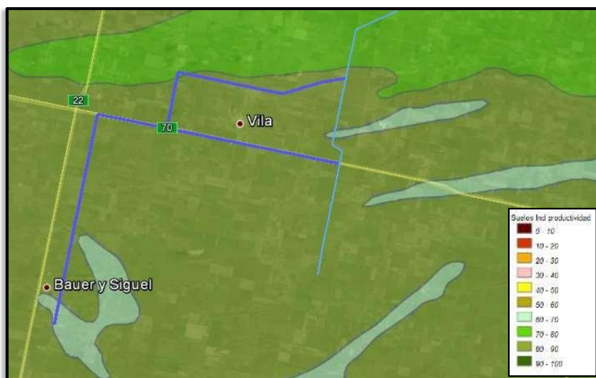
Figura N° 2. Índice de productividad de los suelos

Los suelos presentes corresponden al Gran Grupo de los Argiudoles con Índices de Productividad que varían de 65 a 85 (en una escala de 1 a 100). En la medida que aumenta la calidad de los mismos, disminuyen las limitaciones de drenaje en el balance vertical y las limitaciones por drenaje superficial, aunque el de mayor productividad posee problemas de permeabilidad superficial.