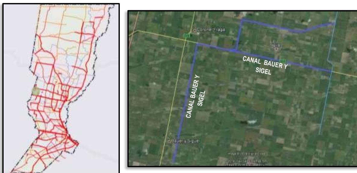
Figura N° 1. Ubicación del área de estudio

Sobre ella se emplazan las localidades de Bauer y Sigel, Vila y Coronel Fraga. La vinculación con el Este del territorio provincial y el Oeste de la vecina Provincia de Córdoba se realiza mediante la Ruta Provincial N° 70 (pavimentada), en tanto que la vinculación Norte-Sur se materializa con la Ruta Provincial N° 22 (pavimentada entre las localidades de Bauer y Sigel y Pueblo Marini). La Ruta Provincial N° 20 (a Santa Clara de Sagüer), la Ruta Provincial 65-S (a Colonia Fidela) y una densa red de caminos comunales, permiten una fluida vinculación local siempre y cuando la zona se encuentre libre de problemas de anegamiento.